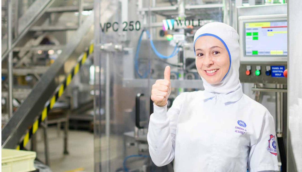
Colaboradora Negocio Chocolates, Colombia.