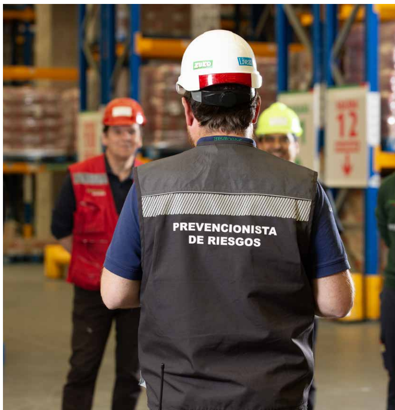
Colaboradores Negocio Tresmontes Lucchetti, Chile.