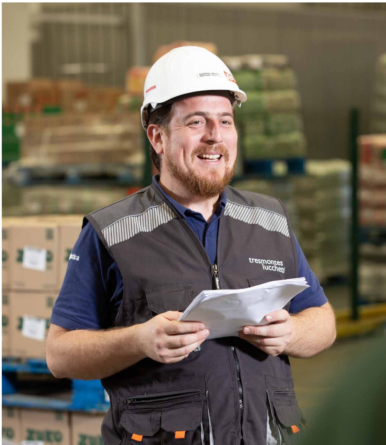
Colaborador Negocio Tresmontes Lucchetti, Chile.